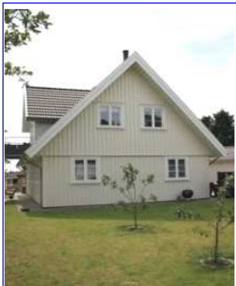
Bien orientée et bien isolée, une maison Asgård consomme très peu d'énergie

Une maison Asgård standard de 135 m 2 est équipée d'un système combiné VMC double flux - pompe à chaleur, qui assure la couverture des besoins de chauffage et d'eau chaude sanitaire.