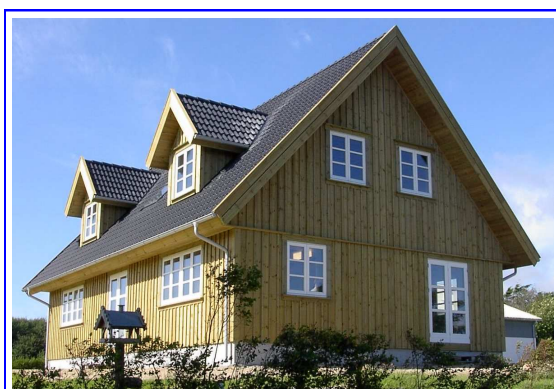
Ci-dessus une maison livrée en « clos – couvert ». Les aménagements intérieurs et les finitions ont été réalisés par le propriétaire.

La gamme de maisons Asgård modulaires s'étend de 60 m 2 à plus de 300 m 2 et offre un choix de prestations personnalisées en fonction des besoins et des désirs de chacun : du « clos - couvert » (hors d'eau – hors d'air) à partir de 790€/m 2 (*) pour les auto constructeurs, jusqu'au « clés en main » à partir de 1790€/m 2 (*) pour ceux qui choisissent la tranquillité.