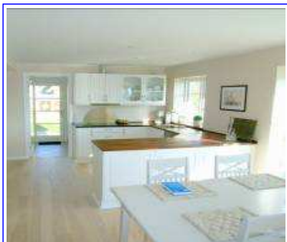
Un intérieur sain et chaleureux