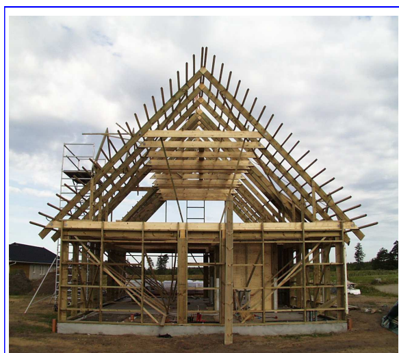
Une ossature garantie 50 ans

L'utilisation de produits isolants haut de gamme et de fenêtres haute performance induisent une transmission thermique exceptionnellement faible, sans pont thermique.